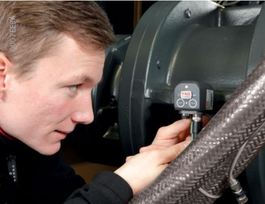
Easy installation and commissioning