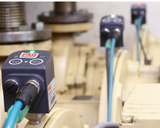
Pump monitoring with FAG SmartCheck